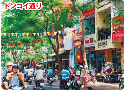
雑貨店などが軒を連ねる熱気と活気あふれる街。今でも営業している植民地時代の貴重な建造物。

●旅行代金に含まれないもの/燃油サーチャージ39,700円、海外空港税3,500円、国際観光旅客税3,000円、羽田空港施設使用料3,850円、カンボジア査証代36USD、代行手数料5,500円(2026年5月1日現在)