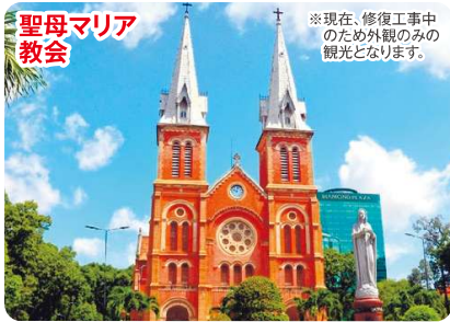
19世紀末に建築された赤レンガ造りの教会。