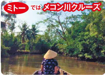
マングローブやヤシの繁るジャングルをクルーズ。