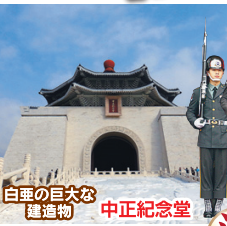
白亜の巨大な 建造物 中正紀念堂