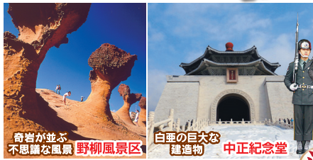
奇岩が並ぶ 不思議な風景 野柳風景区

◆観光にも便利な立地良好な 《デラックスクラスホテル》 シーザーパーク台北に2連泊! ◆台北で外せない 人気の観光地をめぐる。