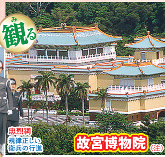
忠烈祠 規律正しい 衛兵の行進 故宮博物院