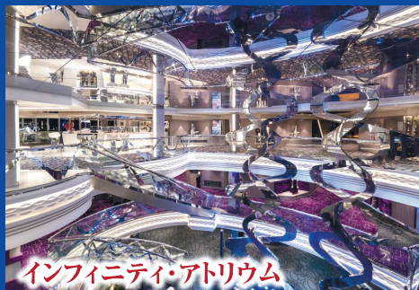
インフィニティ・アトリウム