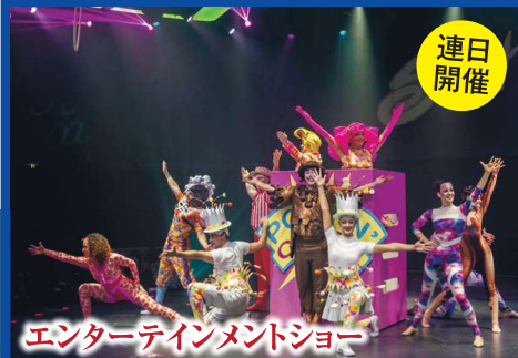
エンターテインメントショー