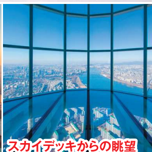
スカイデッキからの眺望

燃油サーチャージ7,400円、現地空港税2,700円、国際観光旅客税1,000円、渡航手数料3,300円、国際旅客保安サービス特別運賃230円が別途必要です。(2026年3月2日現在)