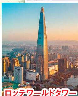
ロッテワールドタワー