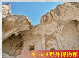
ギョレメ野外博物館

アナトリア高原中央部に広がる岩石地帯。奇岩が林立し巨岩がそびえる景観はまさに自然の脅威です。