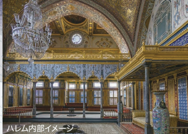
ハレム内部イメージ

トルコ語で「綿の宮殿」を意味するパムッカレ。温泉水が地表に湧き出し、石灰石を侵食・沈殿させることで、純白の棚田のような幻想的な景観を作り上げています。