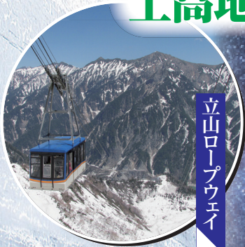
立山ロープウェイ