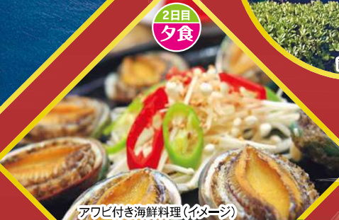
アヒ付き海鮮料理(イメージ)