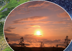
弥陀ヶ原の夕日と雲海 ※気象状況によっては見られない場合があります。